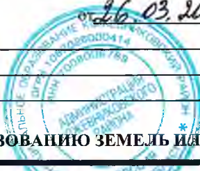
СХЕМА ПРЕДПОЛАГАЕМЫХ К ИСПОЛЬЗОВАНИЮ ЗЕМЕЛЬ ИЛИ ЧАСТИ ЗЕМЕЛЬНОГО УЧАСТКА

Объект: Линии связи, линейно-кабельные сооружения связи и иные сооружения связи, для размещения которых не требуется разрешения на строительство - антенно-мачтовое сооружение связи