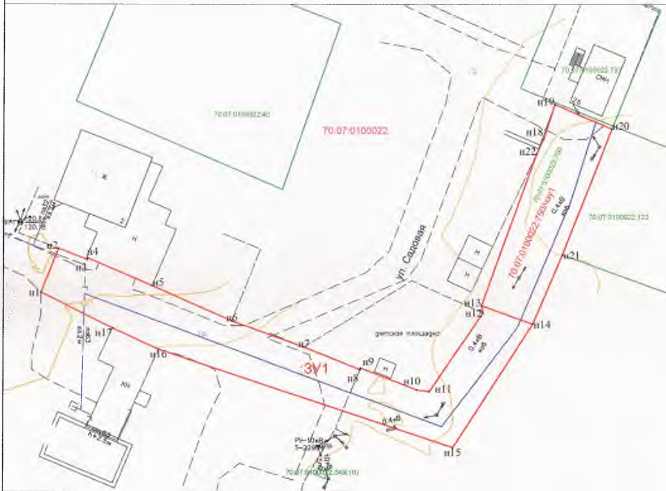
Схема земель и части земельного участка на топографическом плане