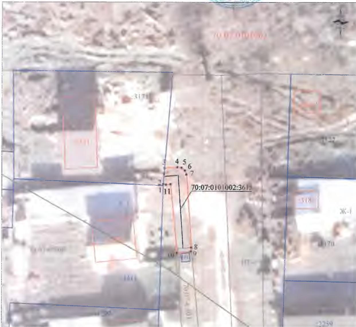
СХЕМА РАСПОЛОЖЕНИЯ ГРАНИЦ ПУБЛИЧНОГО СЕРВИТУТА НА КАДАСТРОВОМ ПЛАНЕ ТЕРРИТОРИИ

Утверждено постановлением Администрации Кожевниковского района № 597 от 14.10. 2024г.