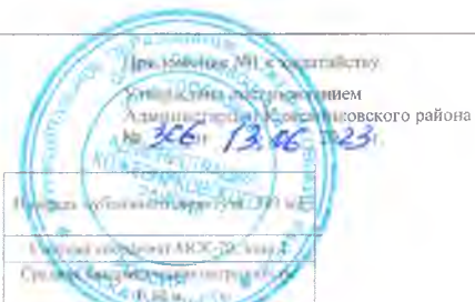
СХЕМА РАСПОЛОЖЕНИЯ ГРАНИЦ ПУБЛИЧНОГО СЕРВИТУТА НА КАДАСТРОВОМ ПЛАНЕ ТЕРРИТОРИИ