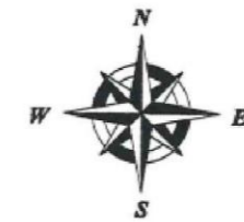
СХЕМА РАСПОЛОЖЕНИЯ ГРАНИЦ ПУБЛИЧНОГО СЕРВИТУТА НА КАДАСТРОВOM ПЛАНЕ ТЕРРИТОРИИ

Земельный участок с кадастровым номером 70:07:0000000:45 Категория земель: Земли населённых пунктов Адрес: Томская область, Кожевниковский район Разрешенное использование: Автомобильный транспорт Площадь земельного участка: 15201 кв.м.