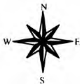
Схема земель на топографическом плане Масштаб 1:500

Цель использования земель - "Распределительный газопровод высокого и низкого давления к жилым домам в с. Кожевниково МКР «Молодежный», ул. Юбилейная, ул. Гагарина, ул. Новосибирская, ул. Молодежная, ул. Ленина, пер. Подгорный".