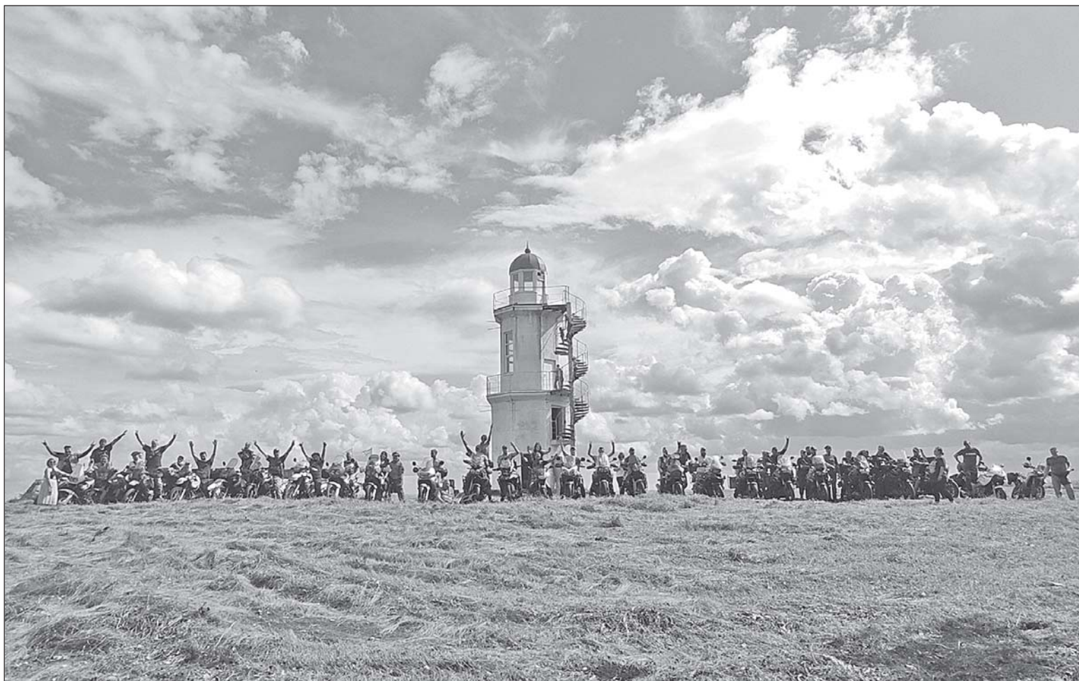
■ Байкеры в Руяне.