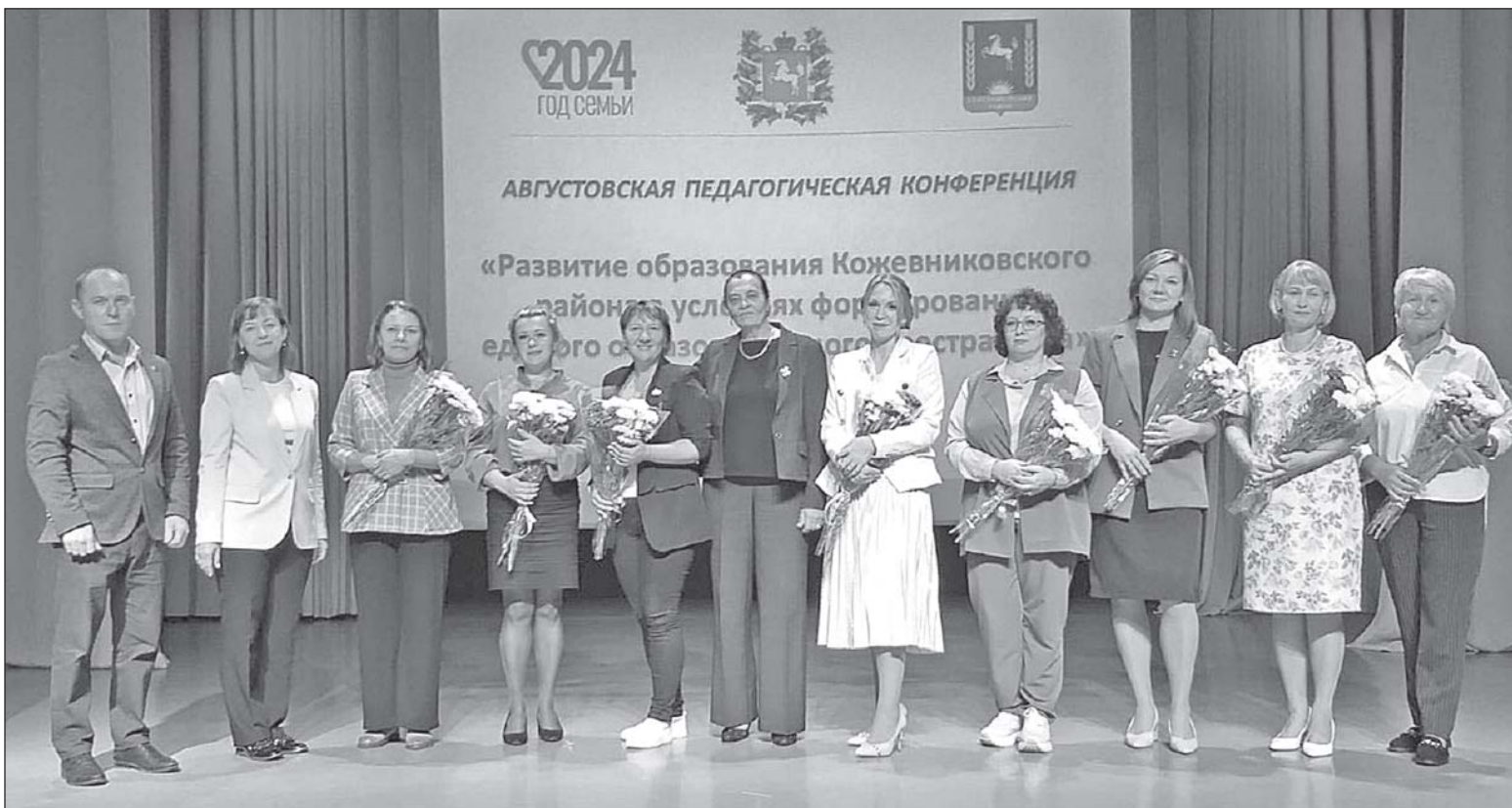
■ Участники конкурсов профессионального мастерства 2024 года.

В этом году все обучающиеся 11 классов по результатам освоения образовательной программы средней школы были допущены до государственной итоговой аттестации. Из 61 выпускника средних школ нашего района до-