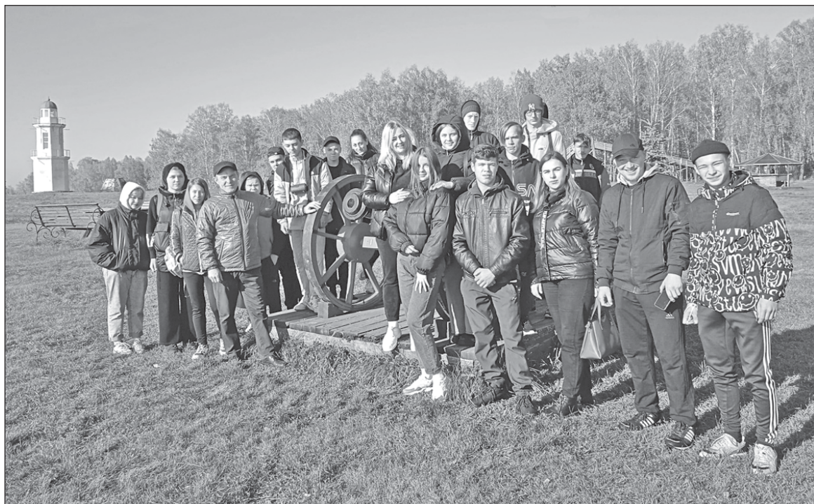
■ Студенты техникума.

Спортсмены демонстрировали своё мастерство, ловкость, виртуозность, жажду борьбы до последнего мяча, стремление к победе. Были оригинальные кульбиты, неожиданные результаты и, естественно, заслуженные победители. Победители получили по традиции изумительный сладкий кубок.