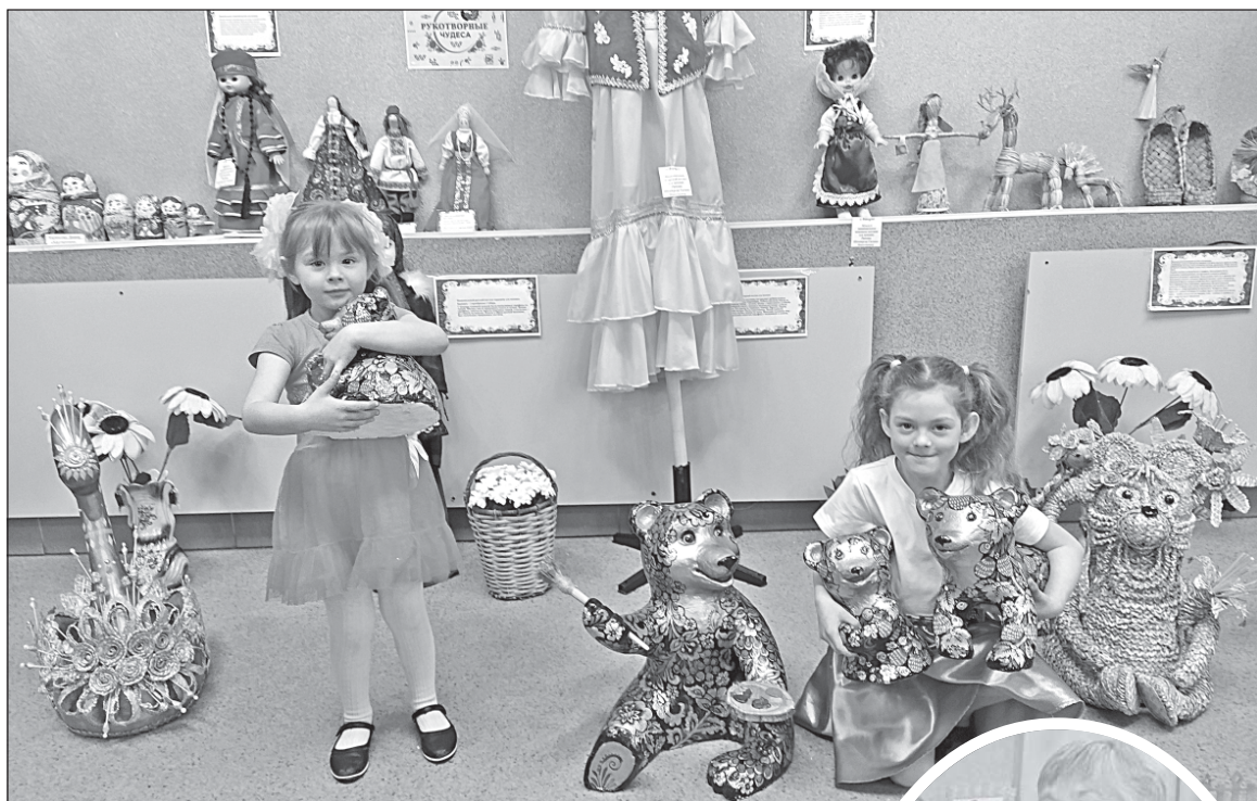
■ На выставке мастеров.

21 апреля творческий марафон фестиваля сельских поселений успешно продолжили вороновцы