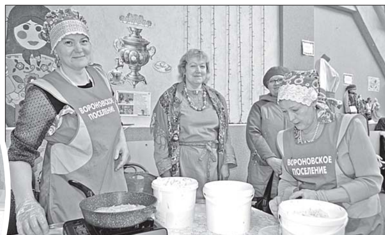
■ Хозяйки из Осиновки.