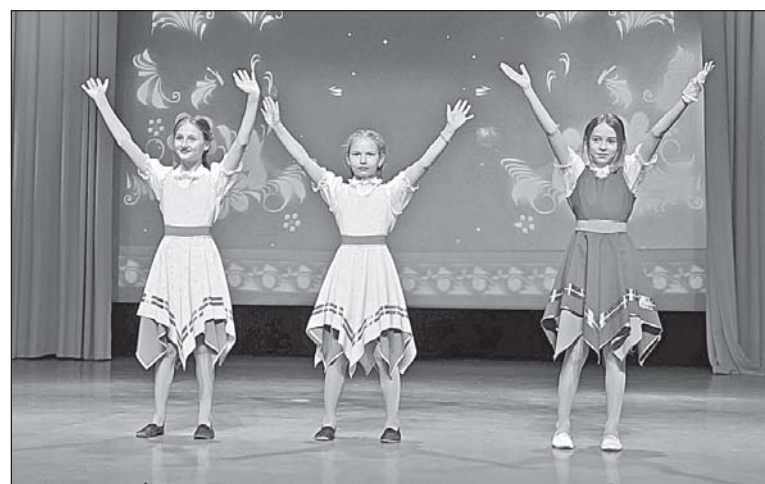
■ Танец «Варенька».