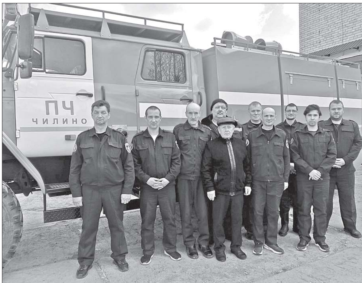
■ Коллектив Чилинской пожарной части.

30 апреля отмечают свой профессиональный праздник представители одной из самых мужественных профессий - пожарные