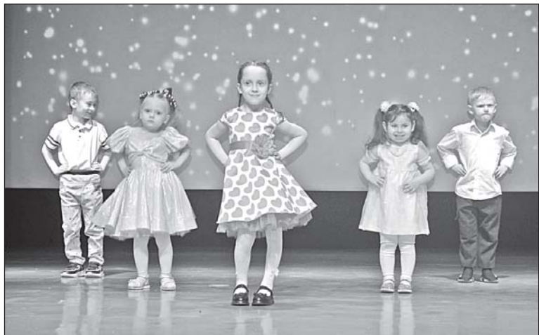
■ Танец «Детки».