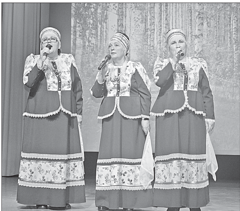
■ Акапельный номер.