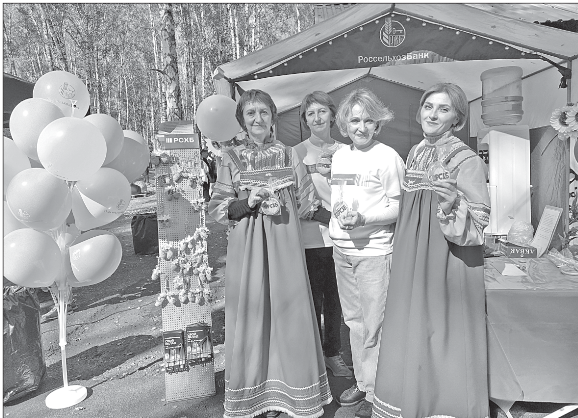
■ Сотрудники «Россельхозбанка».