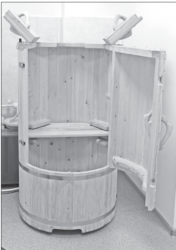
■ Кедровая фитобочка.

массаж для коррекции фигуры, а также массаж лица.