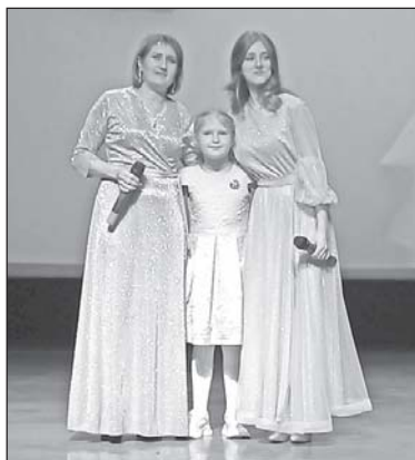
■ Семья Моржуевых.