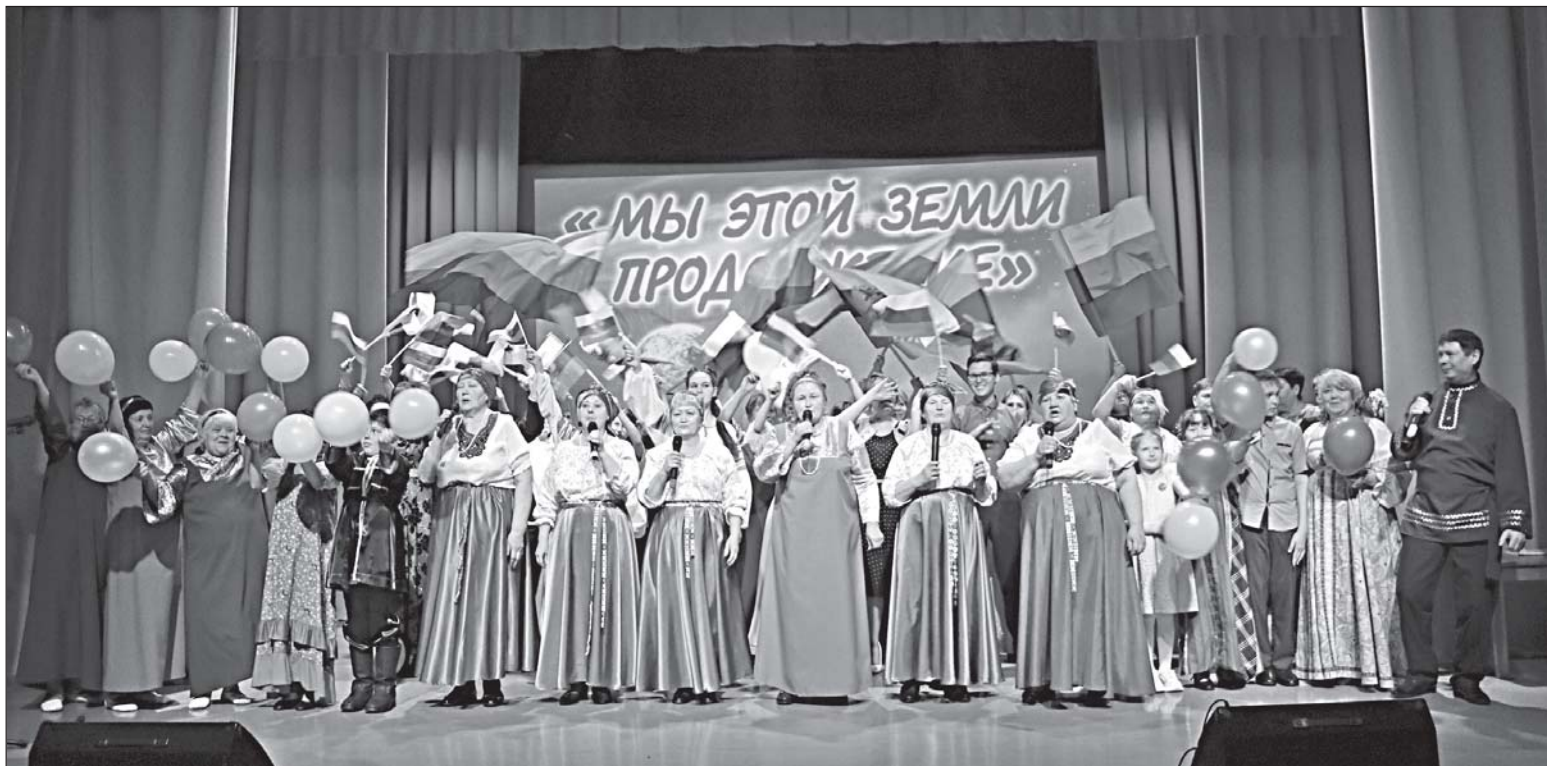
■ Участники художественной самодеятельности.

Влет раскупили на ярмарке говядину и баранину от КФХ «Летяжье». За свежим мясом стояла очередь покупателей. Свою продукцию – пельмени, вареники, манты, котлеты и многое другое – представила