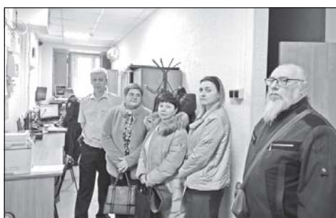
В ОМВД России по Кожевниковскому району состоялось первое заседание нового состава Общественного совета. 3 стр.

Отсрочку могут получить студенты вузов и колледжей с государственной аккредитацией. Это касается и обучающихся в аспирантуре и ординатуре. Ее дают и по состоянию здоровья, если призывник временно не годен из-за болезни: подтверждается на медкомиссии. Помимо этого, отсрочку от армии можно получить по семейным обстоятельствам. На нее могут рассчитывать отцы двух детей, отцы одного ребёнка, но если жена на большом сроке беременности, отцы-одиночки, отцы детей-инвалидов младше 3-х лет. На отсрочку также имеют право военнообязанные с непогашенной судимостью, военнообязанные с учёной степенью, сотрудники МВД, ФСБ, МЧС, ближайшие родственники погибших при исполнении военной службы.