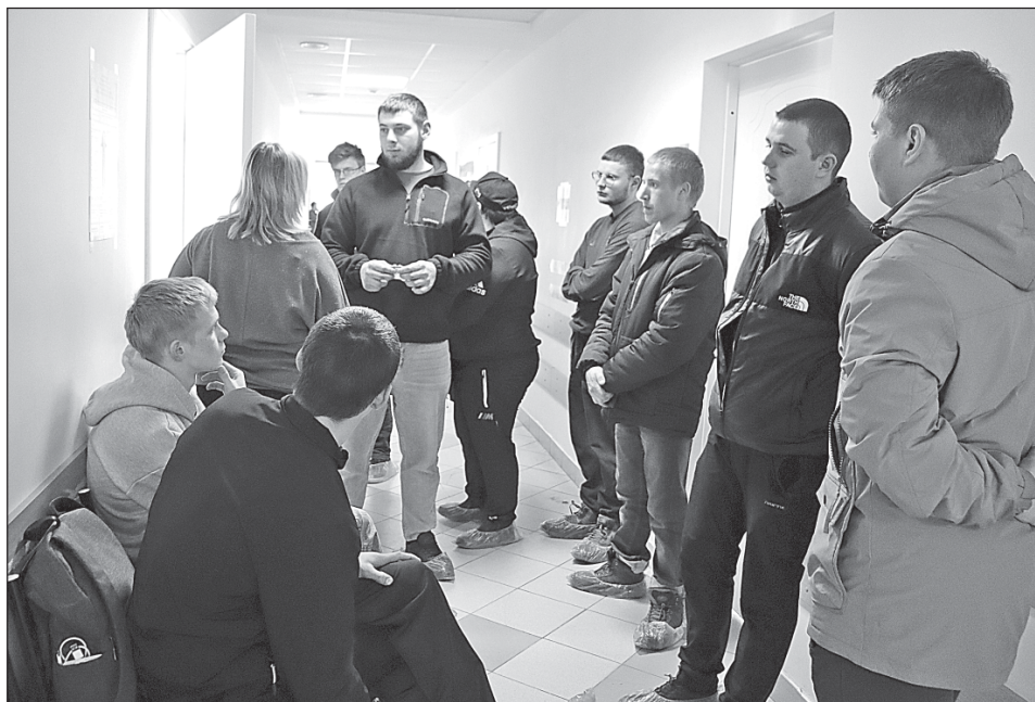
■ На медкомиссии.