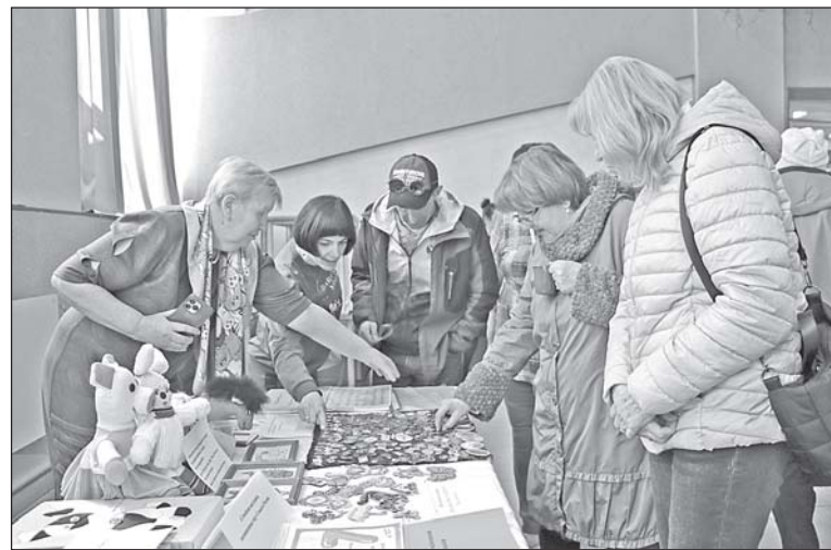
■ Коллекция значков вызвала большой интерес.