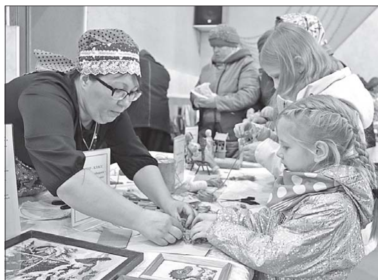
■ Занимательный мастер-класс.

чувственные и яркие номера. Отдельное внимание было уделено тем землякам, кто несет военную службу на Украине. Им в сопровождении фотозаставок участники концерта посвятили песню «Возвращайся домой».