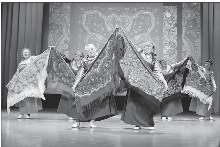
■ На сцене - «Батурчаночка».