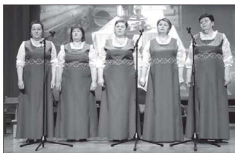
20 апреля прошел творческий отчет Чилинского сельского поселения. Подробности на 4-5 стр.