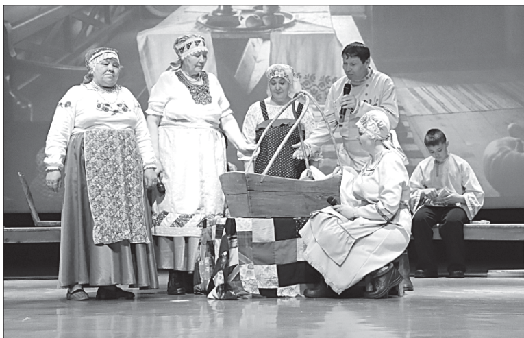
■ Главные герои сценки.