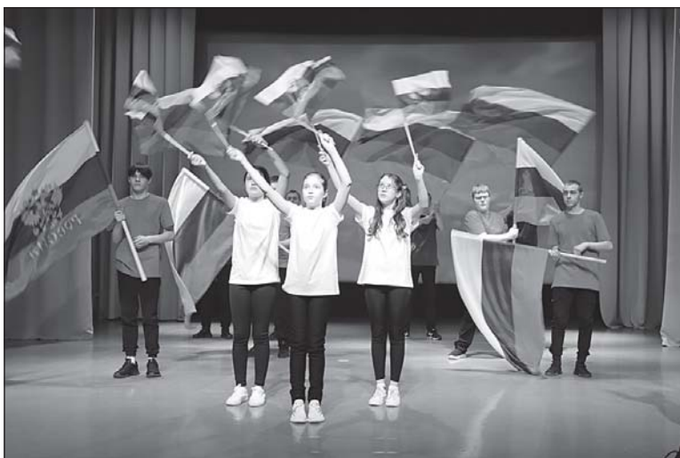
■ Группа «Ребята с нашего двора».