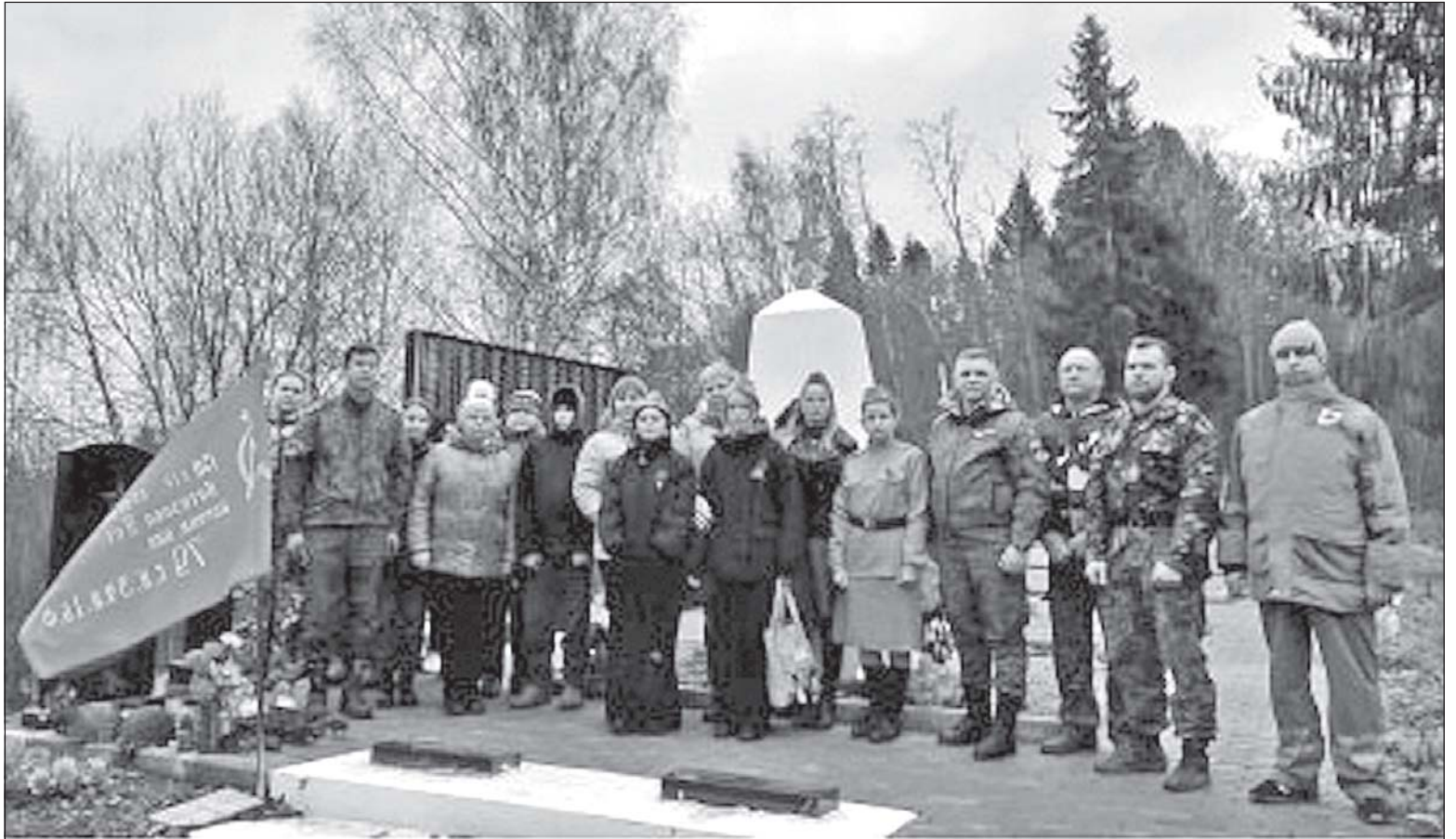
■ Траурная церемония 9 ноября 2024 года. Братская могила в д. Верхнее Заозерье Любытинского района Новгородской области.

Сообщения о поиске родственников бойца были отправлены в город Киров по месту его рождения; в Томскую область село Кожевниково, откуда он призывался на военную службу; в Кемеровскую область - по месту проживания отца; в региональные отделения общественной ветеранской организации в вышеуказанных регионах. Поиск вели сотрудники архивов, ЗАГСов и просто неравнодушные люди на электронных сайтах «Мемориал», «Память народа», «Подвиг народа» и др.