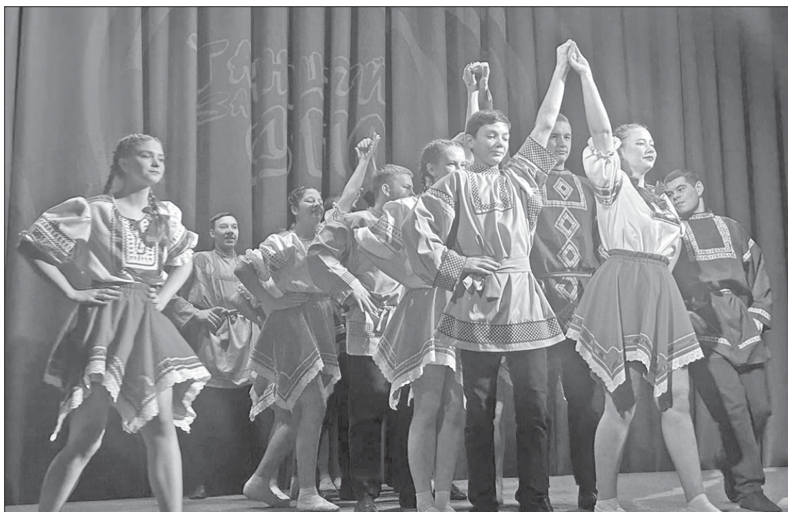
■ Танцевальный коллектив «Истоки».

- 2025 год является юбилейным для нас: мы будем отмечать 85-летие системы среднего профессионального об-