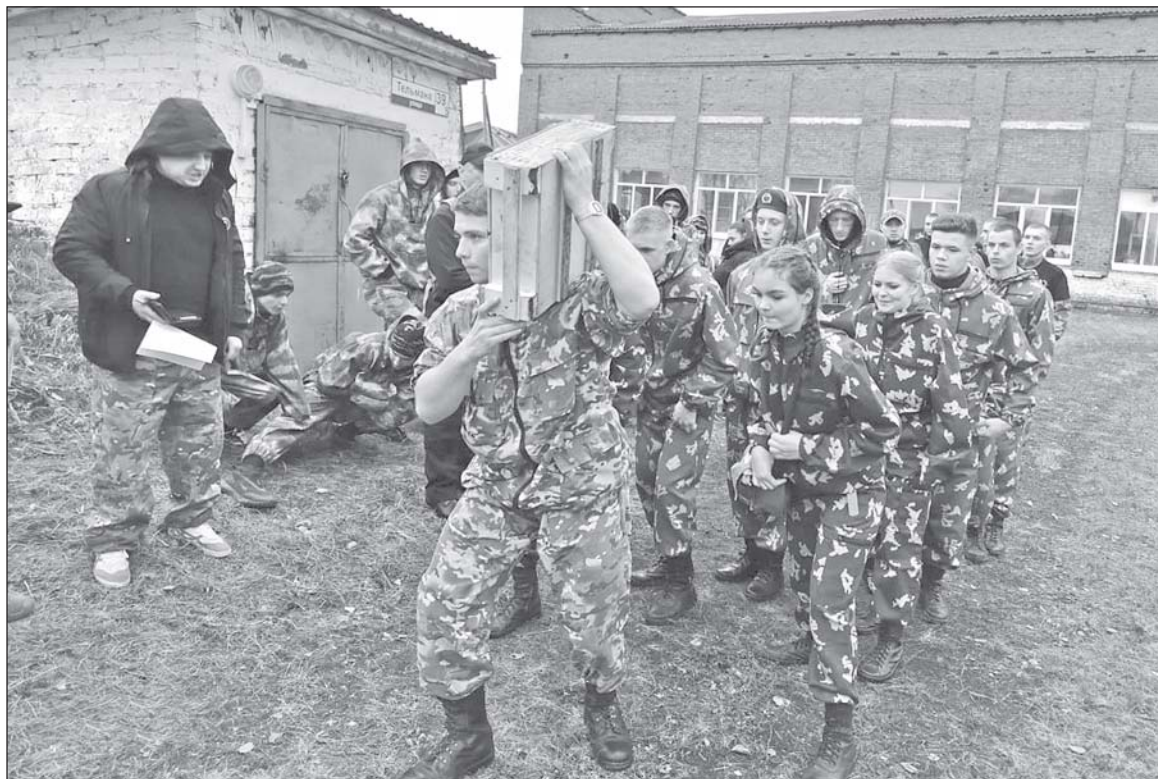
■ Отряд «Дозор» на областных состязаниях «Солдат удачи».