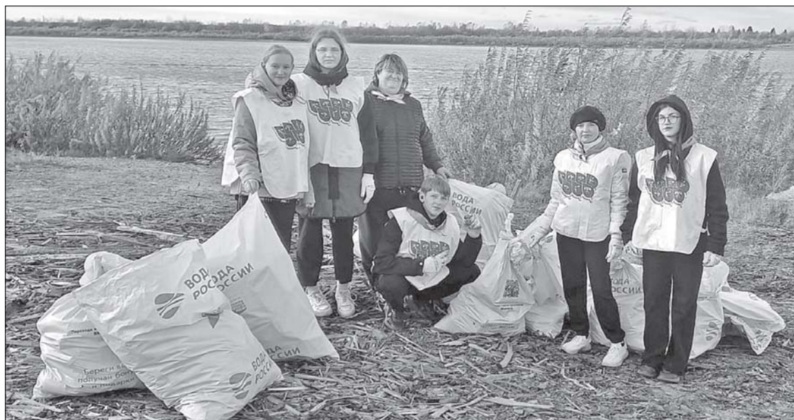
■ Студенты КТАБа на чемпионате по сбору мусора в Томске.