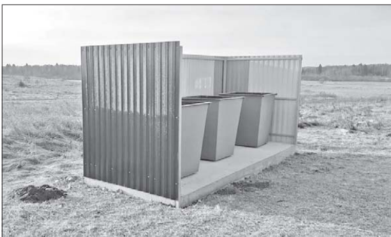
■ Обустройство контейнерных площадок в Новой Ювале.