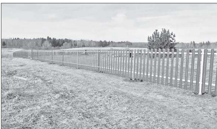
■ Благоустройство территории кладбища в Старой Ювале.

на ограждения территории кладбища в Батурине; в Новопокровском – ремонт водопровода в Десятове (второй этап); в Уртамском – капитальный ремонт участка водопровода; в Кожевникове – благоустройство территории КСОШ №1. Три проекта на конкурсный отбор направлено из Песочнудубровского поселения: установка промывочных колодцев на водопроводных сетях и их ремонт в Терсалгае, Муллове и Новоуспенке. Самыми активными, как и в предыдущие годы, стали жи-