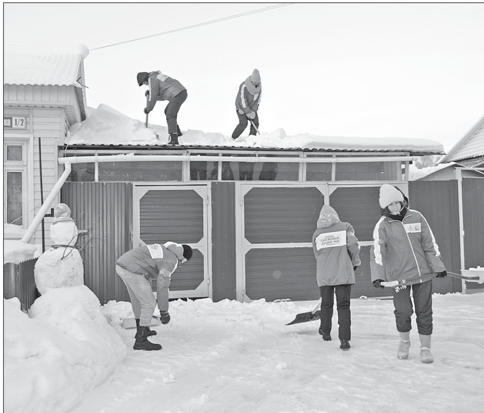
■ Работа студотряда в Кожевникове, 2024 год.