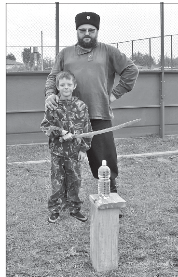
■ Рубка шашкой.