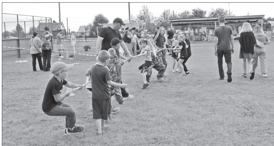
■ Участие в спортивной игре.