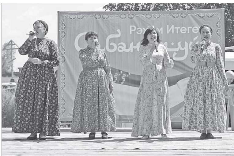
■ Артисты из Новосибирской области.