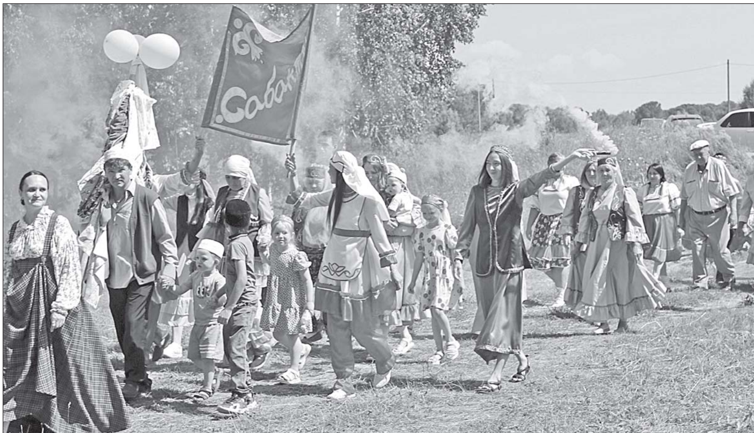
■ Праздничное шествие.