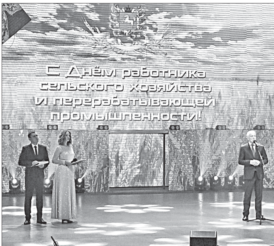
■ Церемония награждения тружеников АПК в 2023 году.