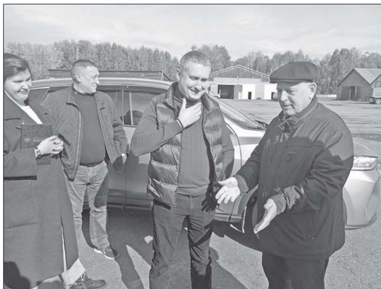
■ В ООО «Колос».