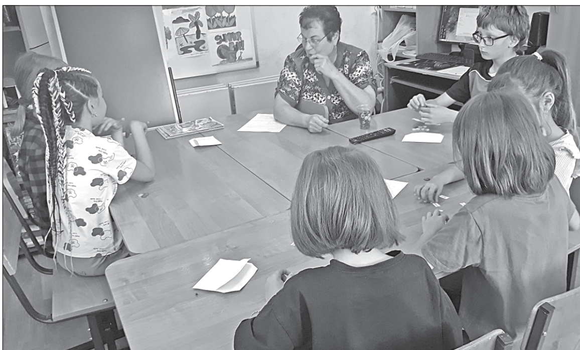
■ На занятиях с детьми.