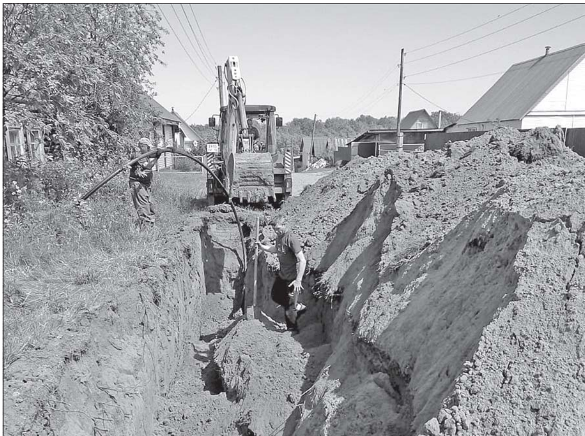
■ Улица Коммунистическая, с. Батурино.

По информации водоснабжающих предприятий района, одно из решений проблемы - замена вводного трубопровода в жилое помещение либо