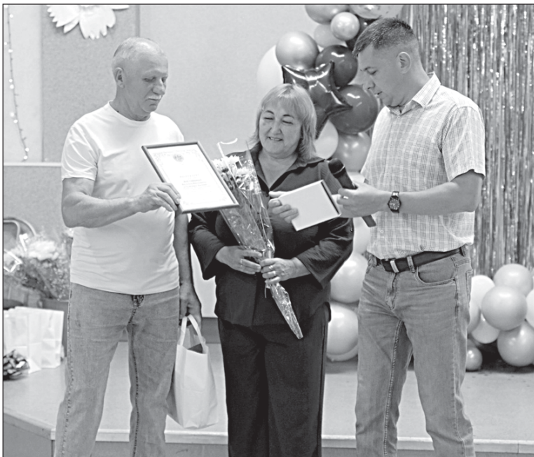
■ Вручение медали «За любовь и верность».

Всей семьей занимались патриотическо-воспитательной работой с молодёжью в школе, участвовали в концер-