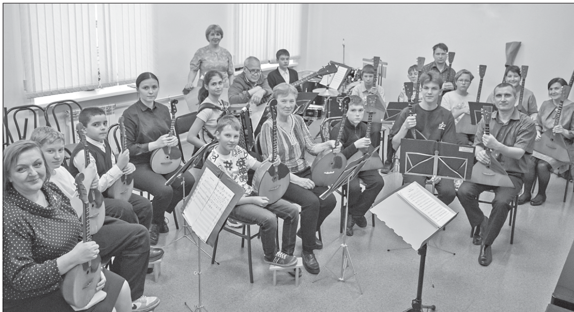
■ Оркестр русских народных инструментов на репетиции.

Более тридцати ребят получают начальное музыкальное образование на баяне, аккордеоне, гитаре. Сфера деятельности отделения многогранна. Юные музыканты реализовывают свои способности в разных видах исполнительского искусства – сольном, ансамблевом, оркестровом музицировании. Они участвуют в областных, региональных, международных