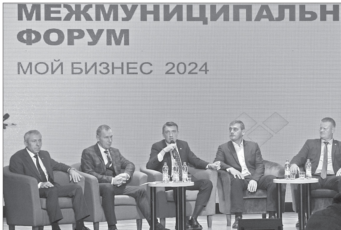
■ Участники форума.

- Но есть те направления, которые не в полной мере задействованы, - рассуждает глава района. - У нас не используются в полной мере дикоросы, нет их глубокой переработки. Еще одно богатство – рыба. Мы сделали первые шаги - открыли пункт приема рыбы, но пока не пере-