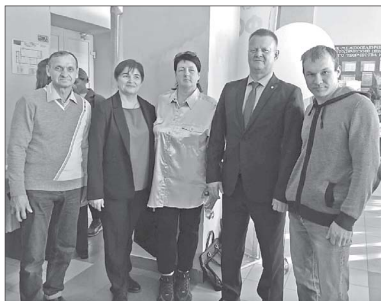
■ Делегация Кожевниковского района.

рабатываем. Мы ведем переговоры, поскольку в районе имеется более двадцати бригад промышленного рыболовства. Это то направление, которое можно и нужно развивать.