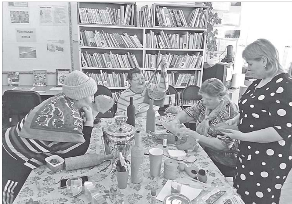
■ Посиделки в Киреевске.

Учреждения культуры в районе активно вовлекают в свою работу население