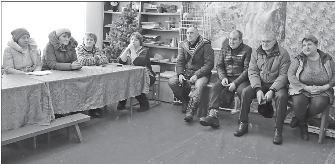
■ На встрече с жителями Борзуновки.

На территорию поселения зашел региональный оператор. Мнения жителей о работе ООО «Партнер», в основном, положительные: на сегодняшний день организация выполняет свою работу в поселении без нареканий. Но есть и те, кто задавал вопросы начисления за