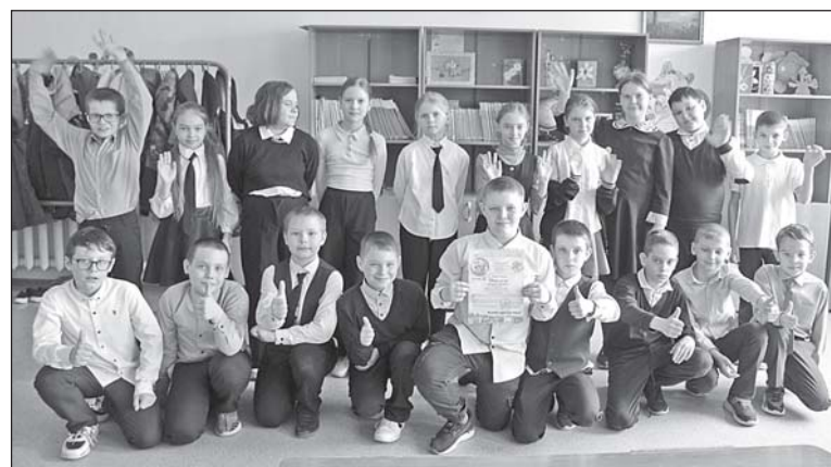
Участники фильма «Доигрался», 4А класс.