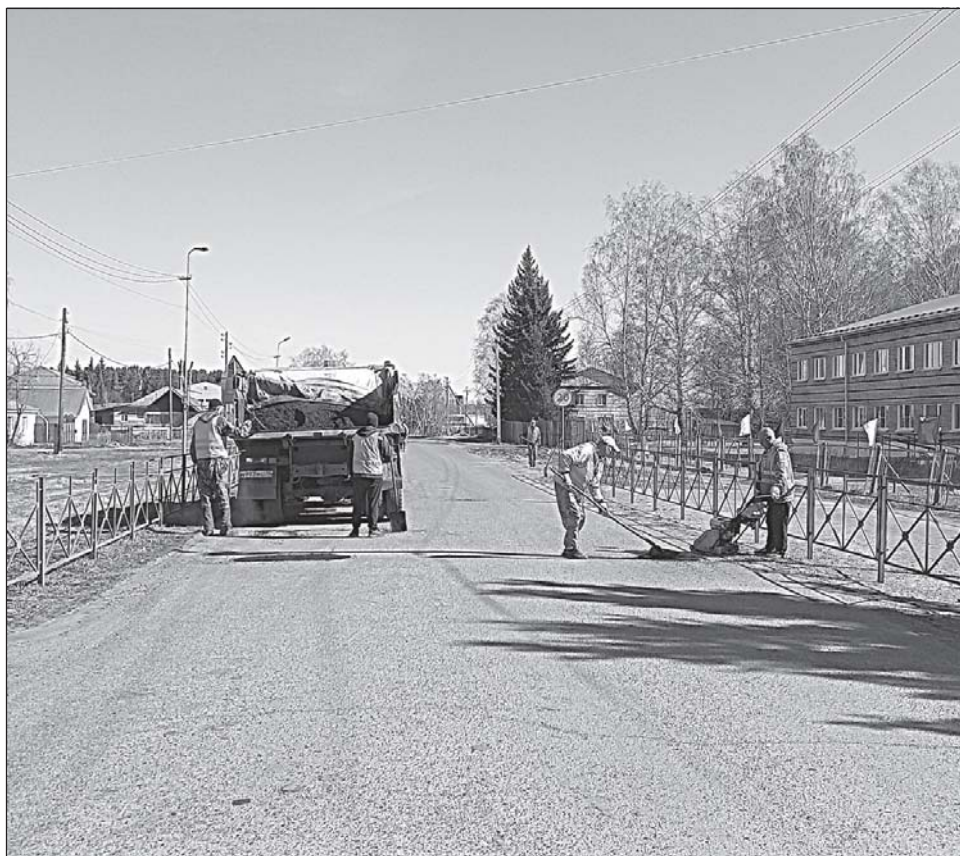
■ Улица Гагарина, с. Кожевниково.