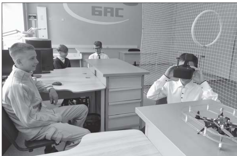
■ В специализированном классе.

- Первого июля в районе на базе нашей школы открылся Центр обучения управлению беспилотными летательными аппаратами в рамках национального проекта «Беспилотные авиационные системы», который будет реализовываться по программе дополнительного образования. В проекте будут участвовать дети из школ района с пятого по девятый классы, всего двадцать пять человек. Занятия состоятся по модулям: 5-6 и 7-9 классы. В старшую группу уже набрали ребят из двух кожевниковских общеобразовательных школ: они обладают минимальными навыками программирования, посещали кружки по робототехнике, участвовали в инженерных сменах, имеют техническое мышление. Программа обширная и очень серьёзная. В течение учебного года их научат собирать, управлять, ремонтировать (есть паяльная станция) и программировать беспилотники. С ребятами будут заниматься по программе дополнительного образования по БАС учитель информатики Алексей Сергеевич Кречмар и физик Константин Анатольевич Филюшин, прошедший теоретическую и практическую подготовку на базе Уральского технопарка в Екатеринбурге. А совсем скоро отправится осваи-