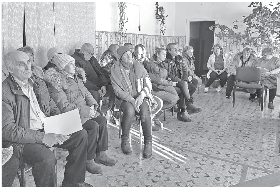
■ Встреча с жителями Осиновки и Волкодаевки.

Глава поселения выразил благодарность еловцам за благоустройство усадеб, рассказал о том, что сделано и что планируется. Ныне провели ямочный ремонт подъездного пути, поставили пять фонарей по улице Центральной, установят и ночной светильник за магазином.