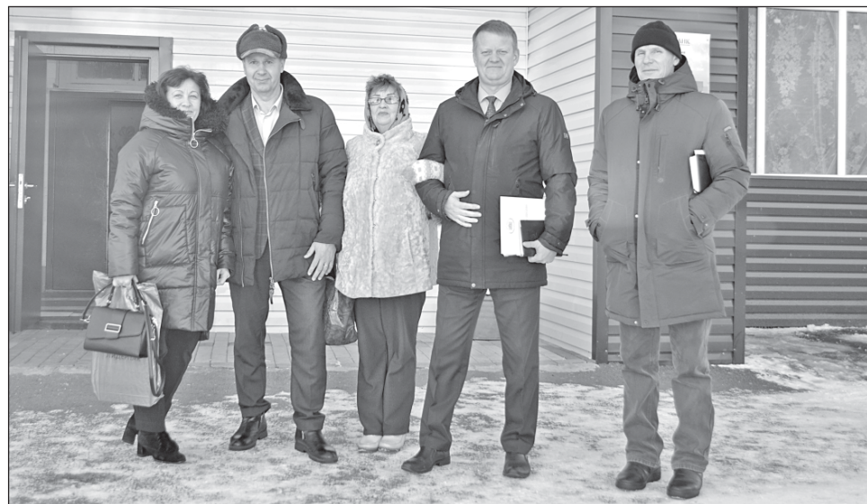
■ Вороновское поселение завершило череду Дней администрации района.