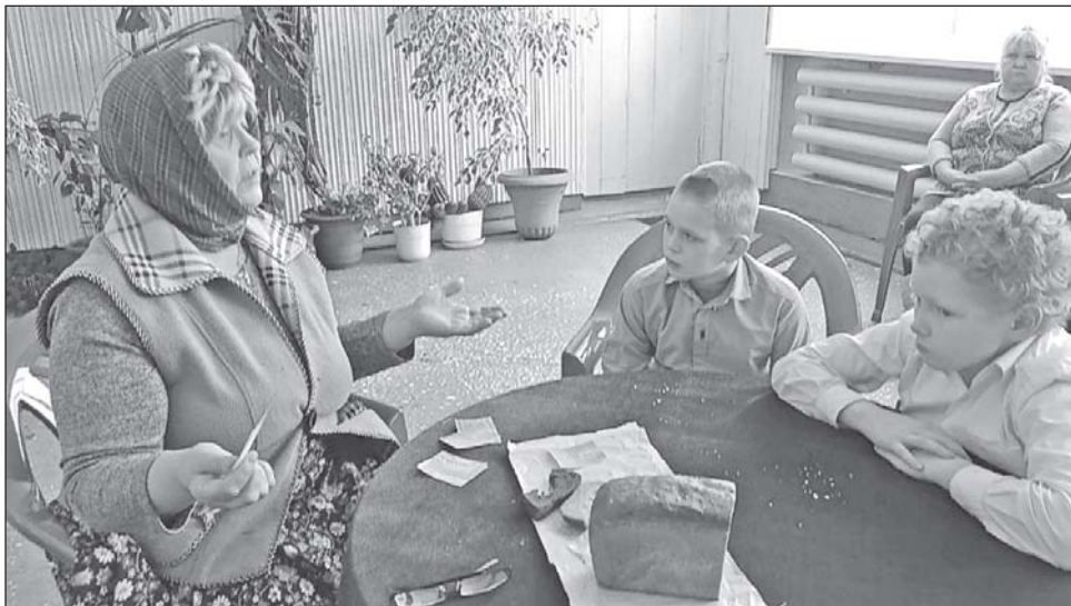
■ В Староювалинском Доме культуры.

В селах района прошли мероприятия, посвященные дню снятия блокады Ленинграда