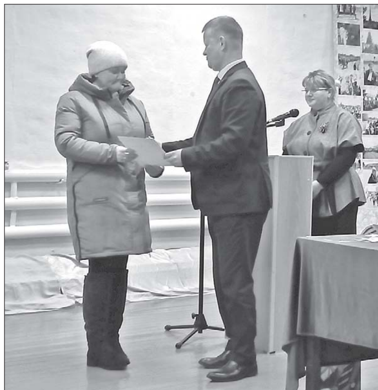
■ Награждение от главы района.