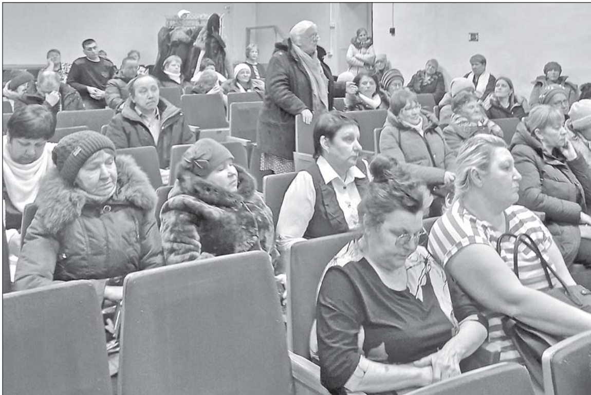
■ В Уртамском Доме культуры.

В рамках реализации проекта по программе «Инициативное бюджетирование» выполнялось благоустройство сквера «Семейный» (первый этап) на общую сумму 1888308,58 руб.: установлено ограждение, построены беседка, туалет, проложены дорожки из ас-