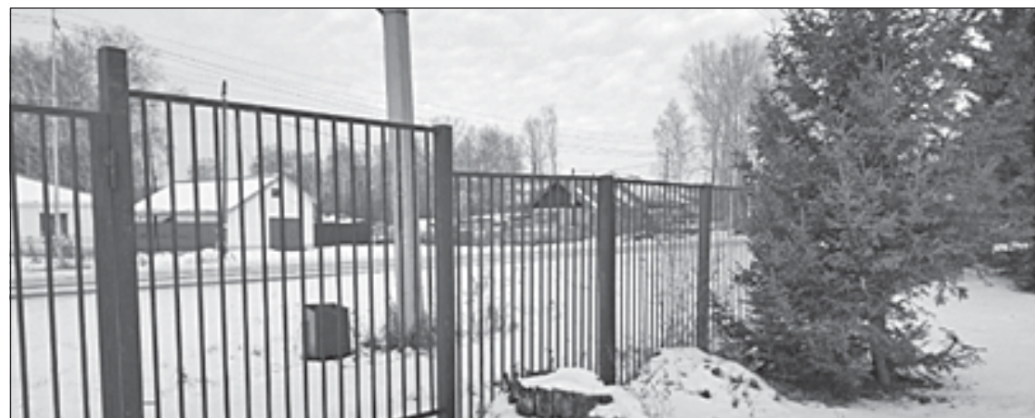
■ Проект изготовления и установки металлического ограждения территории КСОШ №1 до и после.