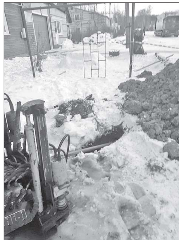
■ Ремонт водопровода на ул. Октябрьской в Кожевникове.