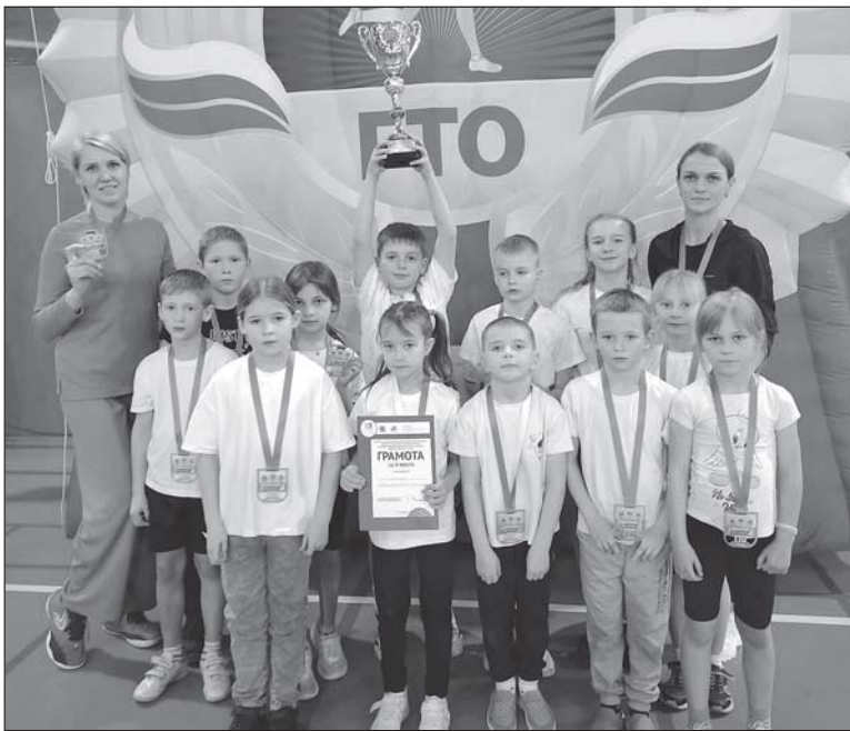
■ Команда КСОШ №1 заняла 2 место в фестивале.

Одним из ярких событий уходящего года стало вручение удостоверений и знаков отличия ВФСК «Готов к труду и обороне» 199 жителям района